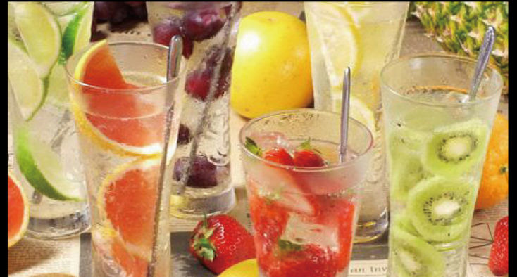
果実ごろごろぶっこみフルーツサワー (いちご・レモン・ライム) 各種 ¥650