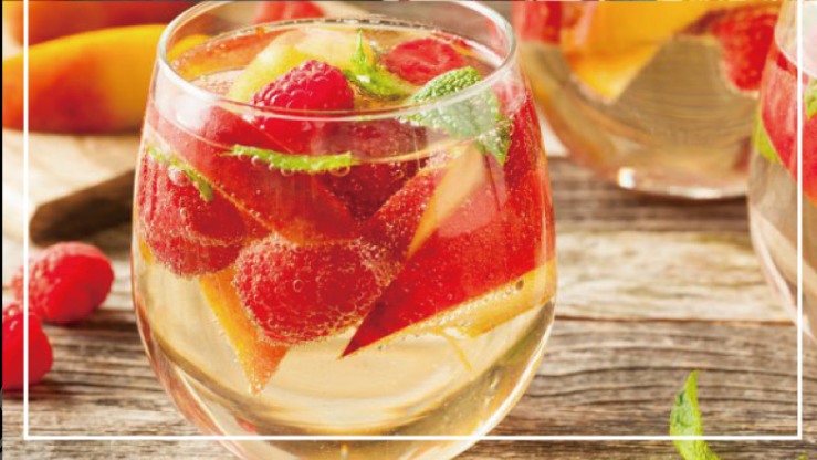
果実漬け込みサンテリア 【赤・白】各種 ¥650