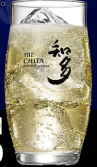
知多【ハイボール】 1杯 ¥1,500

やわらかな味わいと、 ほのかに甘い香り ウイスキーらしい 確かな熟成感があり、 軽やかな飲み心地が特長です。