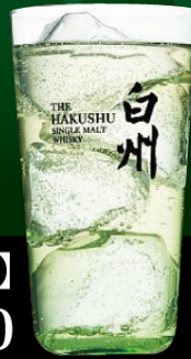
白州【ハイボール】 1杯 ¥1,500

南アルプスの天然水で 仕込まれ森の蒸留所で 育まれたフレッシュな香り、 スツキリとしたキレのある 爽やかな味わい