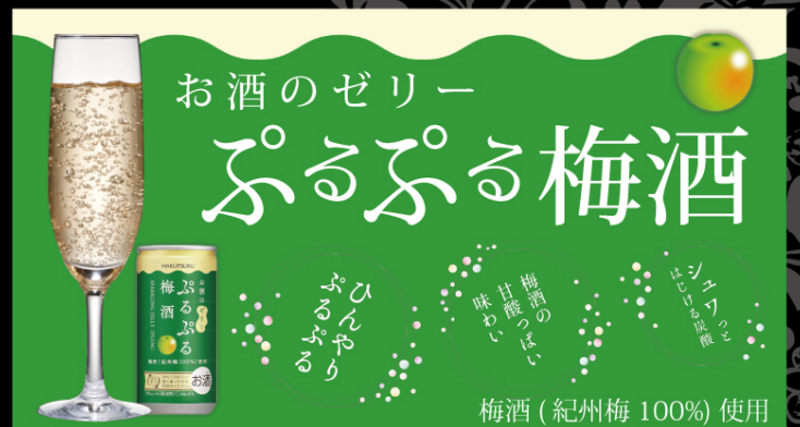
ぷるぷる梅酒スパークリングゼリー ¥650